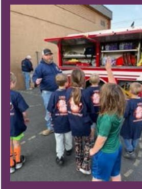
¡Gracias al Departamento de Bomberos de Lind por organizar un gran día de seguridad contra incendios en LES!