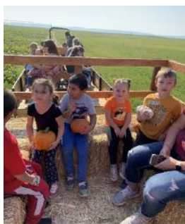
Las clases de TK, K y 1er grado de Lind Elementary fueron a Country Cousins Farm en Othello.