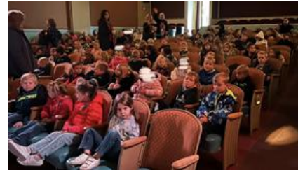
¡Los estudiantes de LES y RGS K-5 pudieron asistir a una presentación de marionetas en The Ritz Theatre!