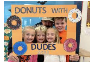
RGS tenía una gran participación en Donuts with Dudes!