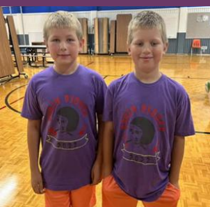
Día gemelo en la Escuela Primaria Lind!