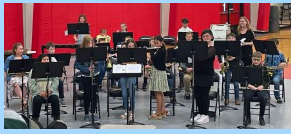
Banda de quinto grado de la escuela primaria Ritzville

Like us on Facebook! Seguir a Lind-Ritzville Escuelas Cooperativas En facebook