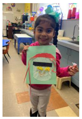
¡Los estudiantes de LES TK aprendieron sobre robots y crearon los suyos propios!