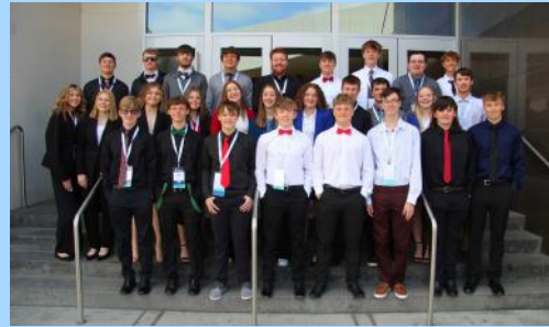
El equipo de LRHS FBLA asistió a la Conferencia de FBLA del estado de WA en Spokane.