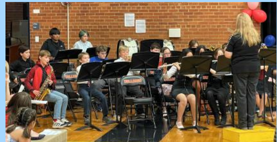
Banda de quinto grado de la escuela primaria Lind