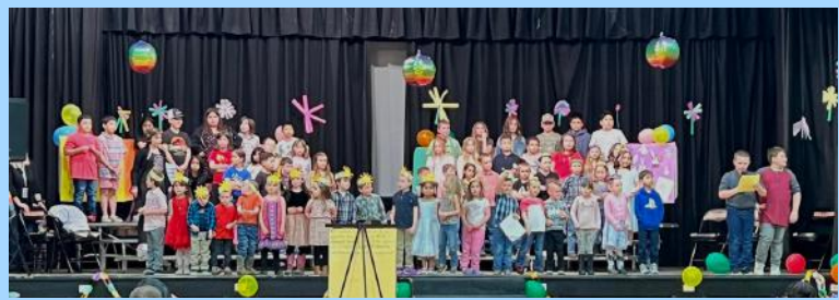
Concierto de primavera de la escuela primaria Lind