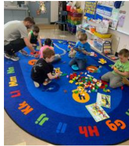
Los estudiantes de LES aprendieron sobre trenes y fuerza usando un kit LEGO Education Stem.