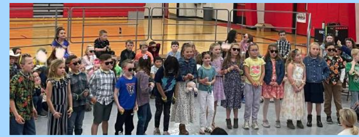
Concierto de primavera de la escuela primaria Ritzville