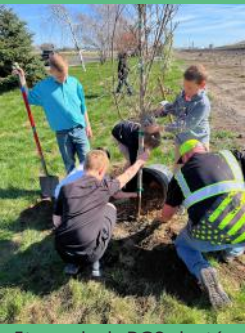
¡5to grado de RGS plantó árboles para el Día del Árbol!