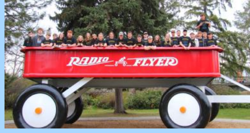
¡El equipo de evaluación de aves de corral de la FFA de Lind-Ritzville obtuvo el sexto lugar en el concurso estatal!